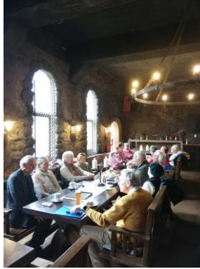
Mittag im Rittersaal