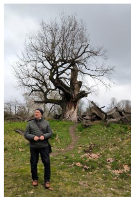
Lenne'Park, alte Eiche