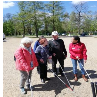
Erlebnismobil Christoffel Blindenmission