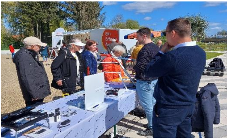
Fa. Eschenbach u. Optiker Scharnbeck