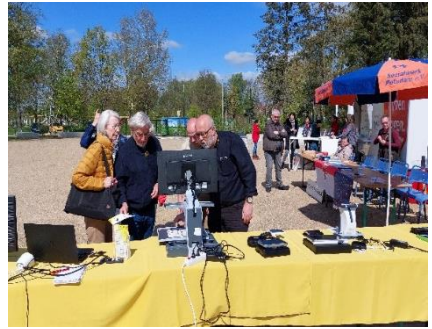
Stand Firma Vistak