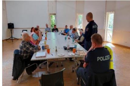
Gruppe der Teilnehmer